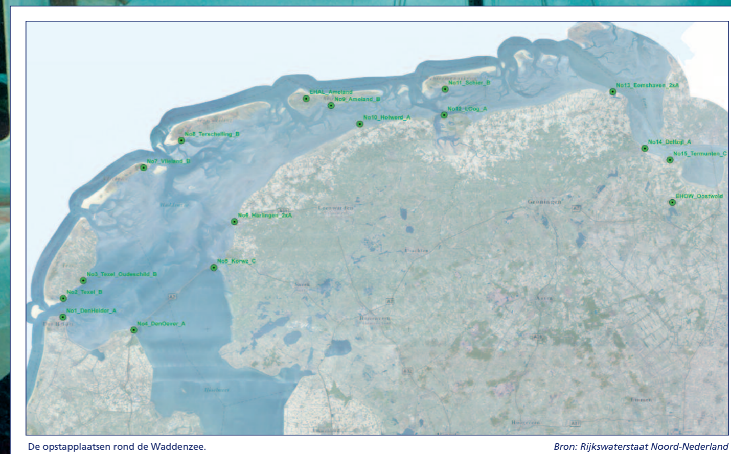
De opstapplaatsen rond de Waddenzee.

Veiligheidsregio Fryslân is de coördinerende veiligheidsregio. De CRW is als zelfstandig onderdeel ondergebracht bij de afdeling Crisisbeheersing van Veiligheidsregio Fryslân. De CRW bestaat uit de waterfunctionaris, de secretaris, het secretariaat en een communicatieadviseur. Eind 2018 omvatte de gezamenlijke formatie 1,5 fte. De waterfunctionaris coördineert de samenwerking tussen de genoemde organisaties.