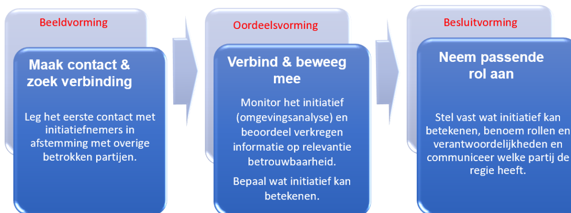
Figuur 1. Stappenmodel omgang burgerinitiatief

Mocht een burgerinitiatief zich aandienen dan kan er gebruik worden gemaakt van een werkwijze. In deze werkwijze zijn op hoofdlijnen een drietal te doorlopen stappen beschreven. Dit komt in grote lijnen overeen met de aanpak die is ontwikkeld door Politie/OM en wordt hierna verder toegelicht.