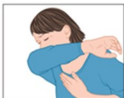
3. Nies en hoest in je elleboog.