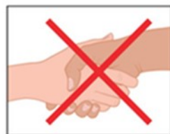
4. Geef geen hand.