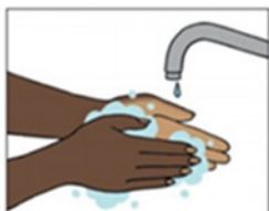
1. Was je handen een paar keer per dag met zeep. Was ook goed tussen je vingers.