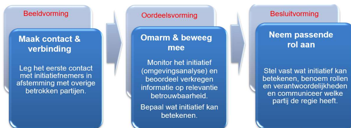
Figuur 1. Stappenmodel omgang burgerinitiatief

Mocht een burgerinitiatief zich aandienen dan is het van belang om erachter te komen wat het doel is van het initiatief, hoe en of het passend en/of helpend is en welke rol vanuit de crisisorganisatie daarbij passend is. Om te helpen dit te bepalen is een werkwijze beschreven met op hoofdlijnen een drietal te nemen stappen. Deze methode komt in grote lijnen overeen met de aanpak die is ontwikkeld door Politie/OM en wordt hierna verder toegelicht.