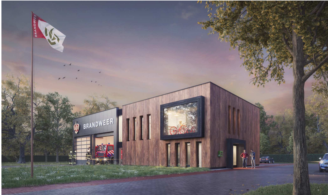
Figuur 2. Impressie blauwdruk brandweerkazerne

In het huidige beleid prevaleert lokaliteit boven centrale raamcontracten. Dit beleid komt voort uit de visie op vrijwilligheid welke bij regionalisering is opgesteld. Deze visie is ongewijzigd. De toetsingscommissie adviseert het bestuur in deze om vast te houden aan het huidige beleid om lokaliteit zo veel als mogelijk te stimuleren. Daarbij luidt het advies om conform de blauwdruk te gaan bouwen om onnodige ontwerp/architect kosten te minimaliseren.