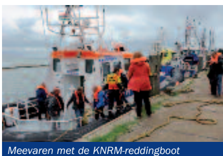
Meevaren met de KNRM-reddingboot