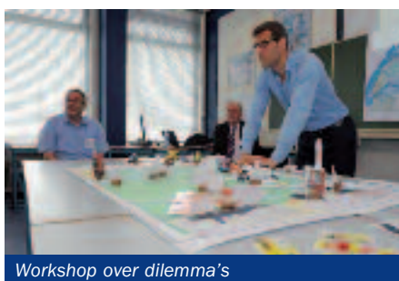
Workshop over dilemma's