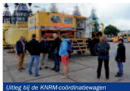
Uitleg bij de KNRM-coördinatievragen