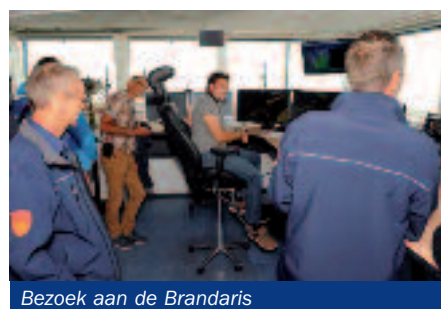
Bezoek aan de Brandaris