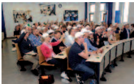
Het spel '1 tegen 100' in volle gang