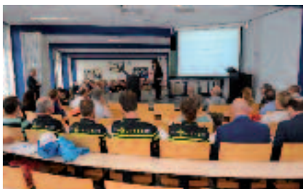
De bijeenkomst telde 120 deelnemers

Navraag leerde dat deelnemers deze themabijeenkomst als nuttig ervaren. Op 8 november en in 2017 volgen nog drie CRW-themabijeenkomsten (zie 'Varia' op pagina 3).