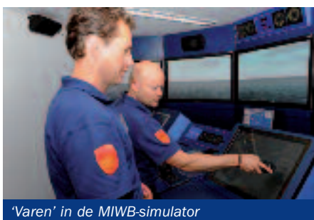
'Varen' in de MIWB-simulator