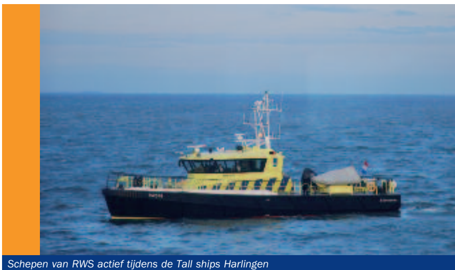
Schepen van RWS actief tijdens de Tall ships Harlingen

Ook worden plannen gemaakt om met centralisten 'op locatie' te gaan, waarvan de verwachting is dat het bijdraagt aan een betere