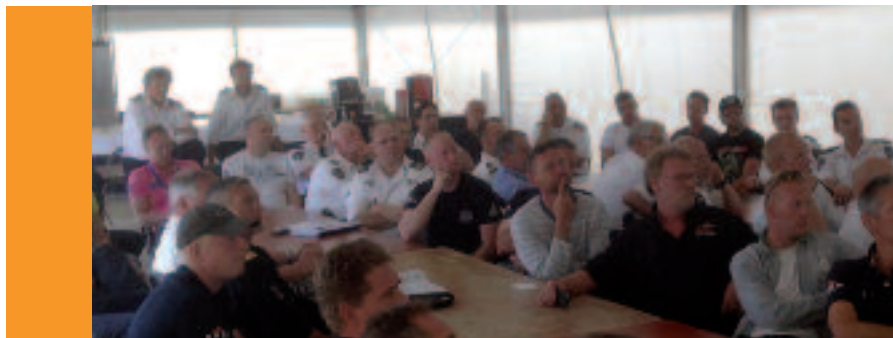
Briefing nautische partners TSH

“De ervaringen tijdens Sail Den Helder 2013 hebben wij meegenomen in onze voorbereiding en ook hebben we dankbaar gebruik gemaakt van de Helderse draaiboeken. Ook vanuit Delfzijl hebben we veel informatie en draaiboeken ontvangen (het maritiem evenement Delfsail wordt eens per vijf jaar georganiseerd red.). Hierdoor hadden wij al snel een goed idee hoe we de zaak aan moesten pakken. Ook de ervaring van verschillende diensten die ook in Den Helder actief waren heeft hierbij een belangrijke rol gespeeld.”