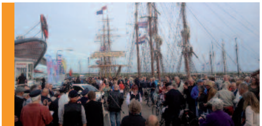
Deel van het evenemententerrein WillemsHAVEN