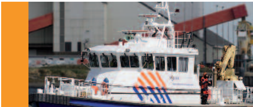
Voorheen KLPD tegenwoordig Landelijke Eenheid Politie, actief tijdens de Tall ships Harlingen

Het landelijk overleg waterfunctionarissen wordt gevormd door de waterfunctionarissen van Waddenzee, IJsselmeer, Zuid-Hollandse en Zeeuwse Stroom, Noordzeekanaal en Noordzee. De doelstelling van dit overleg is op nationaal niveau het uniform, watergericht optreden te bevorderen. In 2013 fungeerde de waterfunctionaris CRW als voorzitter van het landelijk overleg. Onder zijn voorzitterschap