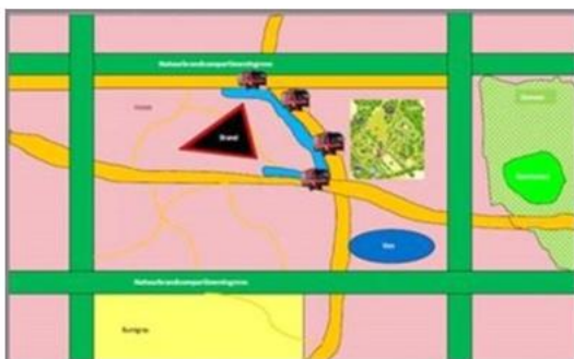
Kwadrant 3: Defensief, toegankelijk brandvak