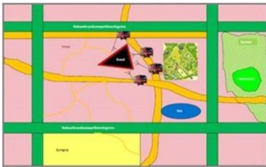
Kwadrant 1: Offensief, toegankelijk brandvak